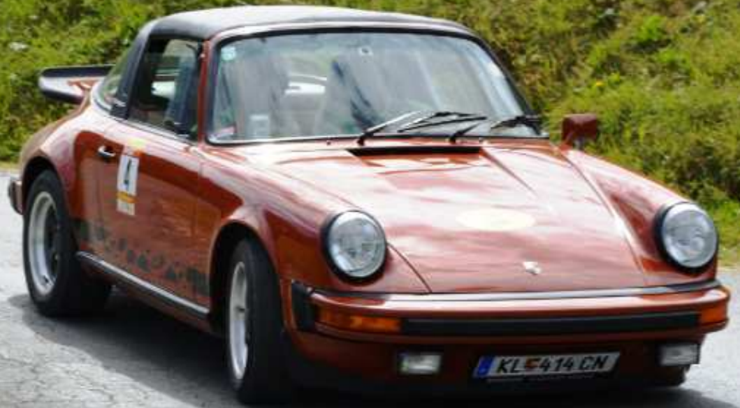
MAK Srecko / SCHATZ Clemens, Porsche 911, BJ 1975; Gewinner des KCC 2016