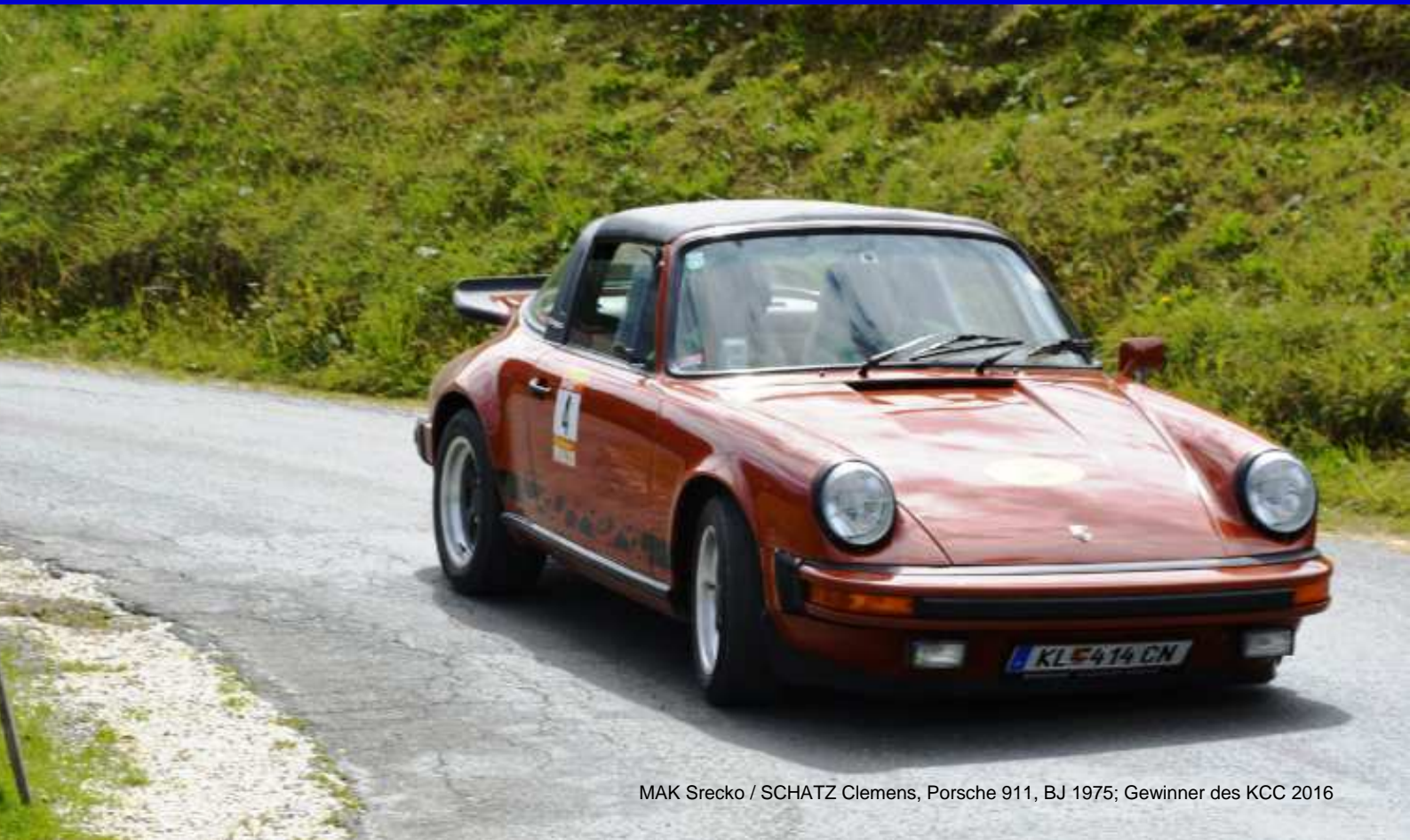
MAK Srecko / SCHATZ Clemens, Porsche 911, BJ 1975; Gewinner des KCC 2016